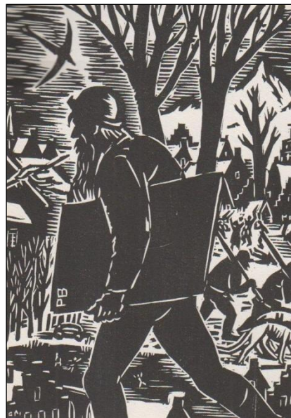
N° 1146 Frans Masereel

1215 ZOLA (Émile). Les Rougon-Macquart. P., Jean de Bonnot, 1982-1983, 15 vol. 8° (sur 20), rel. édit. ornées de motifs dorés et à froid, têtes dorées. Ill. d'après des gravures d'époque. – Est. 25/50